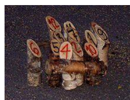
Quilles numérotées utilisées pour le mölkky